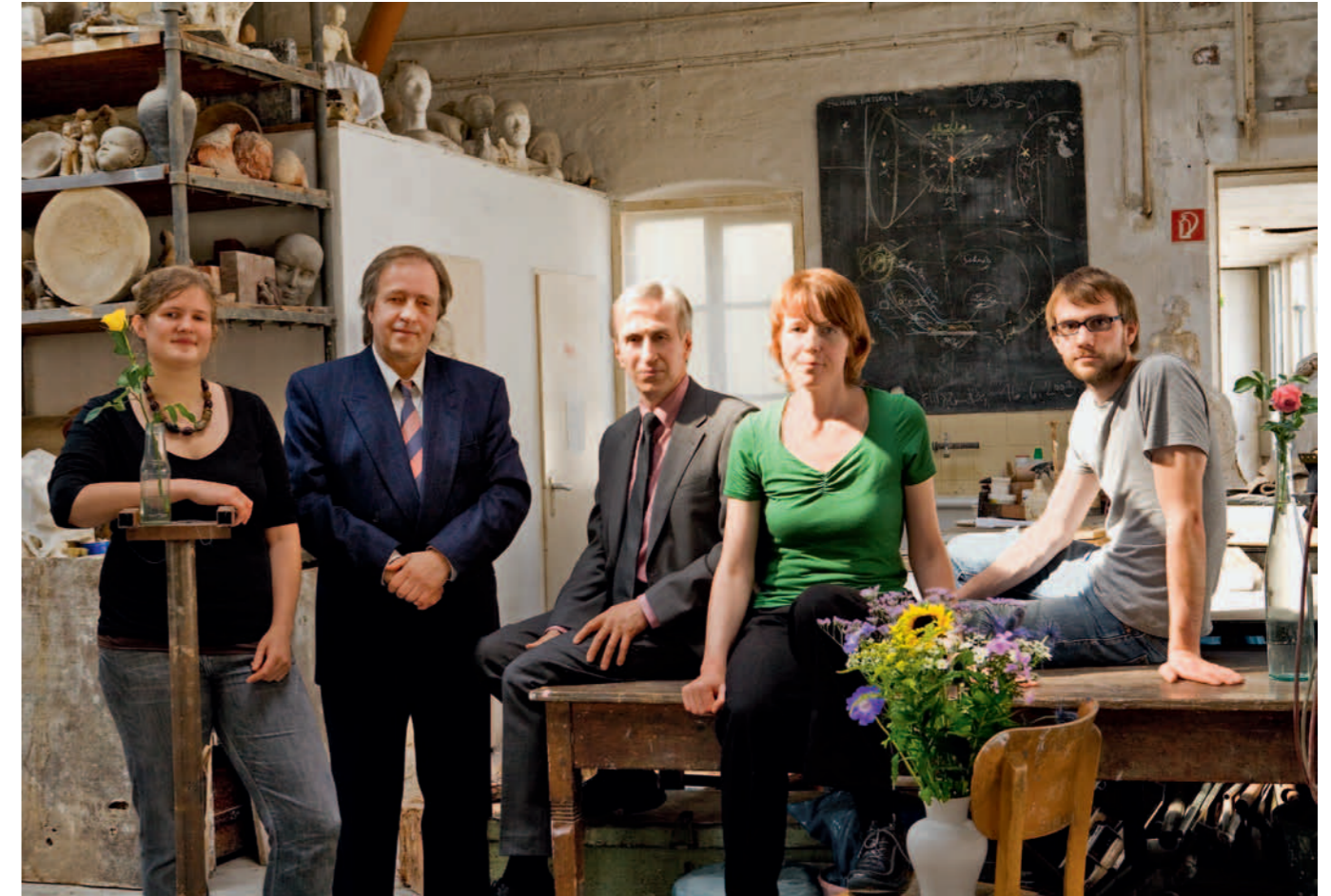
Will den öffentlichen Raum gestalten: die Freie Kunstschule Hamburg

Ich bin Anstifter, weil ich selbst erfahren habe, dass eine wirklich innovative Idee zwei Dinge braucht: ein sehr überzeugtes Engagement für die Sache und die Unterstützung, also »Anstiftung«. Als Förderer in dieser Hinsicht engagiert sich Vladi Private Islands bereits seit vielen Jahren, sei es nun in den Bereichen Hilfsprojekte für Kinder- und Jugendliche, Kultur oder Umwelt. Eine gute und zukunftssträchtige Idee sollte gefördert werden.